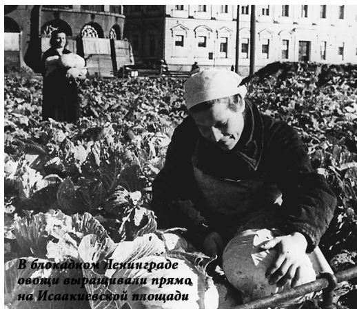
В блокадном Ленинграде овощи вывозили прямо на Исаакиевской площади

Фашисты застали Ленинград врасплох, но даже несмотря на это, не сумели захватить его молниеносно: на защиту города встали все жители, невзирая на возраст и пол. И тогда, потерпев неудачу, вражеская армия решила взять город измором. В блокадном кольце оказалось 2,5 миллиона человек, в том числе тысячи ребятишек (эвакуировать успели не всех).