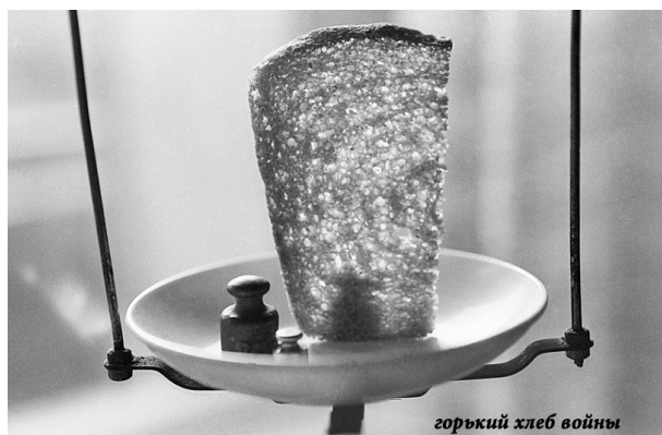
горький хлеб войны