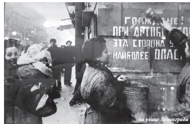
на улице Ленинграда

За Армию — красу и гордость планеты страждущей земной. За наш угрюмый, темный город, втройне любимый и родной! За горе, гибель и позор врага! За жизнь! За власть Советов!»