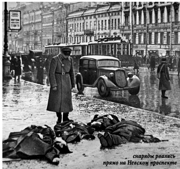
снаряды рвались прямо на Невском проспекте