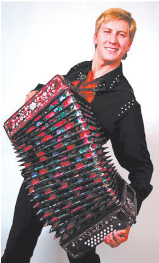
◀◀ начало на стр. 1